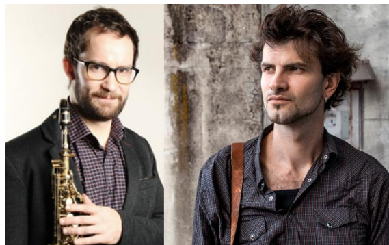
EP © Große Geldermann VP © Sylvain Gripoix